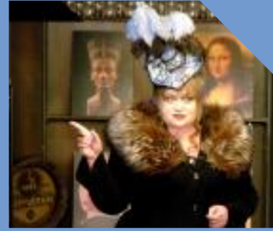
dolce vita Lauenförde