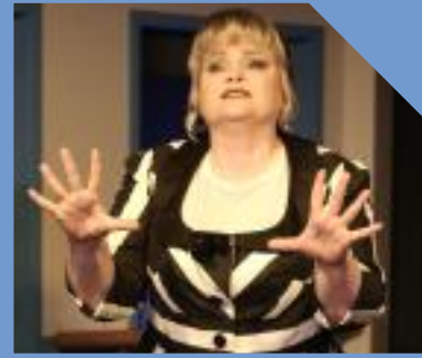
dolce vita Lauenförde