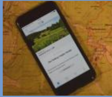
Tourenapp SVR Solling-Vogler