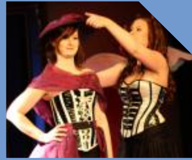
dolce vita Lauenförde