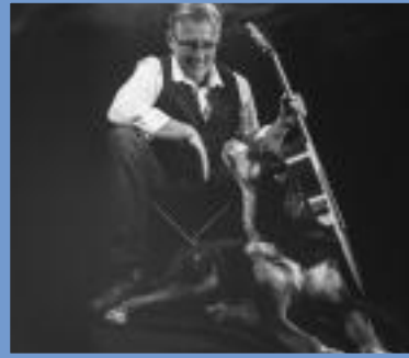
Konzert Stegliz Lüerdissen